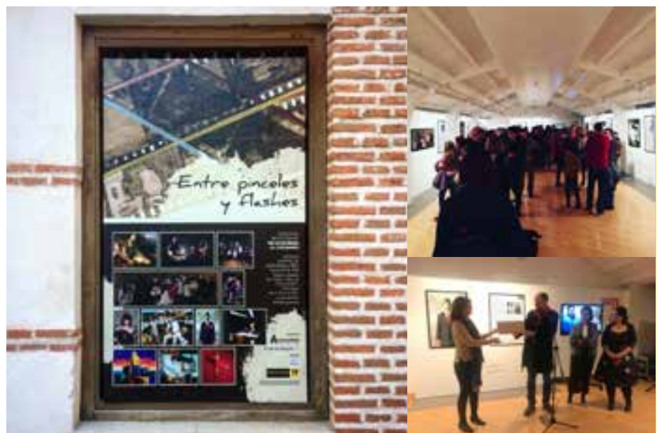
Proyecto fotográfico y exposición Entre pinceles y flashes 2019