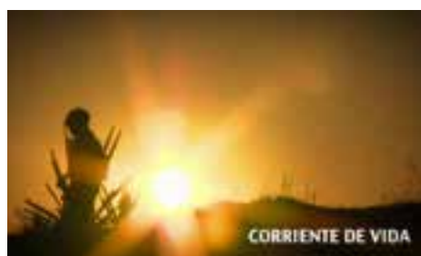
Lagometraje | 90 min Corriente de vida

La apuesta narrativa de este documental se atreve, además, a correr el riesgo de incluir, mediante la ficción, la realidad de una mujer maltratada que registró en un diario el proceso destructivo al que se vio sometida por su pareja.