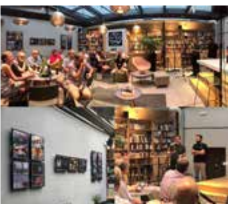
Exposición Finalistas del certamen fotográfico: La ciudad en fiestas