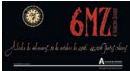
Certamen fotográfico Marcha Zombie Ediciones 2016, 2017, 2018 y 2019