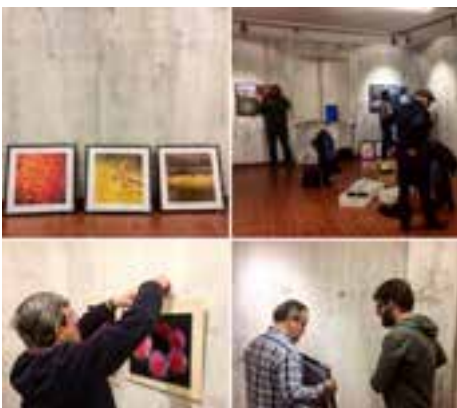
Proyecto fotográfico y exposición "Abstracciones" 2018