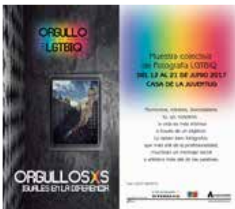
COMISARIADO DE EXPOSICIÓN junio de 2017 Orgullosxs Iguales en la diferencia