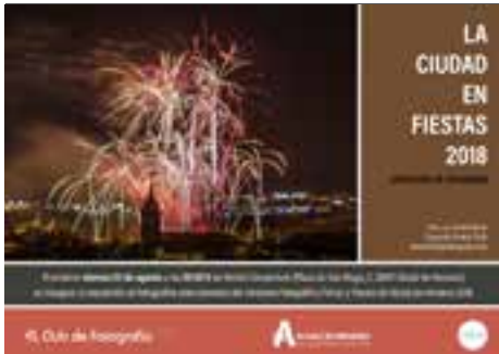
Certamen fotográfico La ciudad en fiestas Siete ediciones del 2016 al 2023