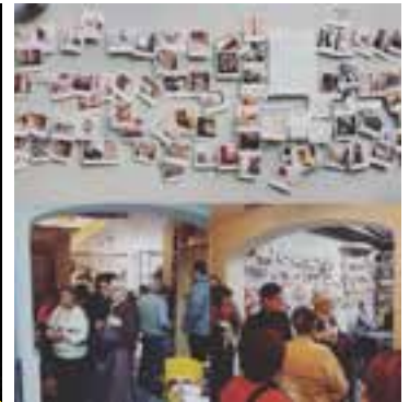
Proyecto fotográfico y exposición "En construcción" El club de fotografía 2018