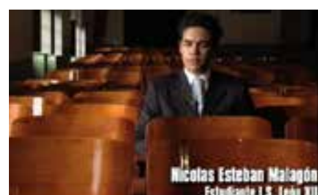
Cortometraje | 25 min La formación...

La tesis del documental, explora, a través de entrevistas a cooperantes internacionales y algunos de los protagonistas de las historias, como la educación es la manera más realista de cambiar las realidades económicas y sociales de estos países.