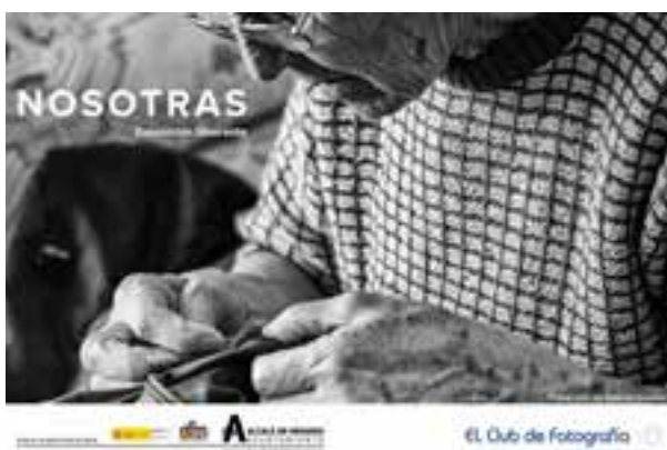
COMISARIADO DE EXPOSICIÓN Colaboración con el programa de ocio y tiempo libre Otra forma de moverte 2016