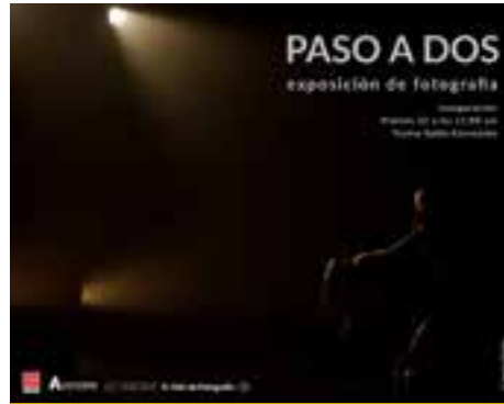
Proyecto fotográfico "Paso a dos" El club de fotografía 2018