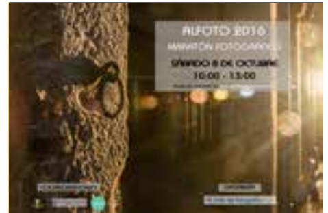
Rally fotográfico ALFOTO Ediciones 2015 y 2016