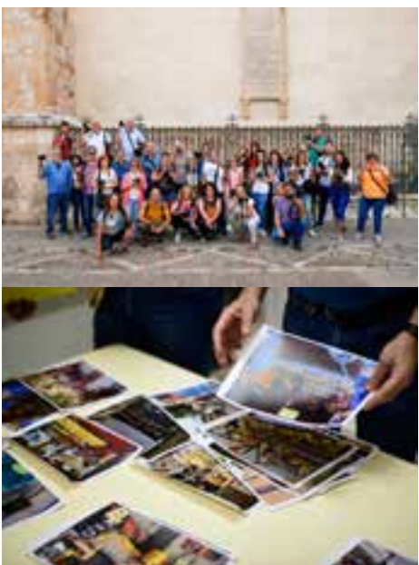
Taller de fotografía de viajes Fotografía en el mercado

Se trató, además, de la primera de muchas actividades fotográficas abiertas y gratuitas organizadas desde la entidad en la ciudad de Alcalá de Henares.