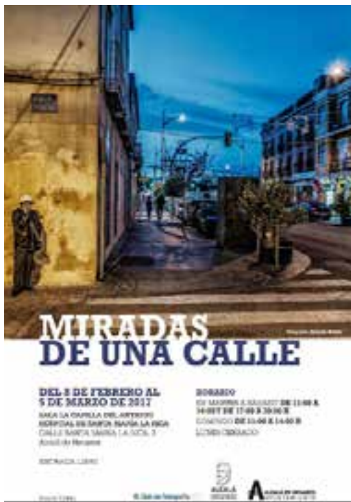
Proyecto fotográfico y exposición "Miradas de una calle" 2017