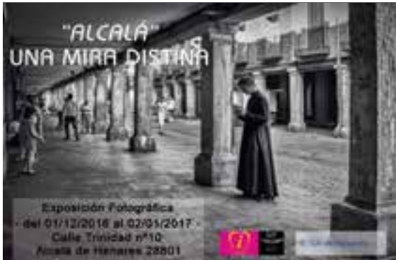
Exposición de fotografía "Alcalá una mirada distinta" El club de fotografía 2017