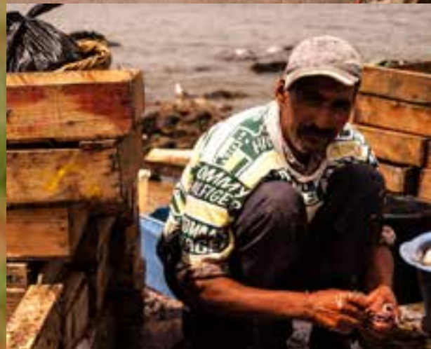
EDUCANDO PARA AVANZAR | 2007

Trabajo fotográfico sobre las misiones Salesianas en distintos países de África y Latino América. 2007. Enmarcado en el proyecto documental "Corriente de vida" Producido por Kodiak Producciones, S.L. para Jóvenes y Desarrollo.